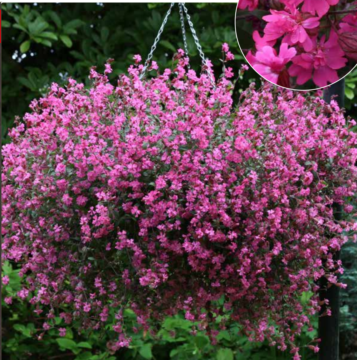
'Sibella Carmine', fantastische Farbenfunken in Purpurrot im Frühjahr und Sommer

Noch immer auf der Suche nach einem lebhaften Farbkleck, um den Garten so richtig zum Strahlen zu bringen? Dann sollten Sie sich 'Sibella Carmine' einmal näher anschauen! Diese neue "Hängengelke" ist ein vielseitig im Garten verwendbares Blütenwunder - egal ob im Beet oder im Topf. 'Sibella Carmine' wächst zu üppigen Pflanzen heran, geradezu perfekt für die Bepflanzung von Körben, Töpfen und Ampeln im Frühjahr, als Beetschmuck oder Terrassenpflanze im Sommer. Kein Verblütes Abzupfen, 'Sibella Carmine' ist